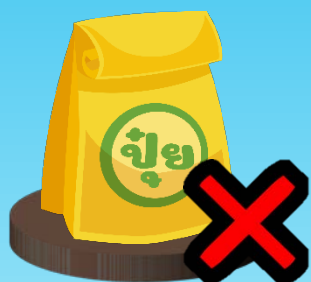
ปุ๋ยขาดตลาด