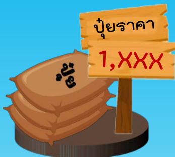
ปุ๋ยราคาแพง