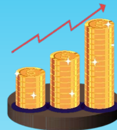
ต้นทุนการผลิต สูงขึ้น