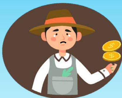
รายได้ลดลง